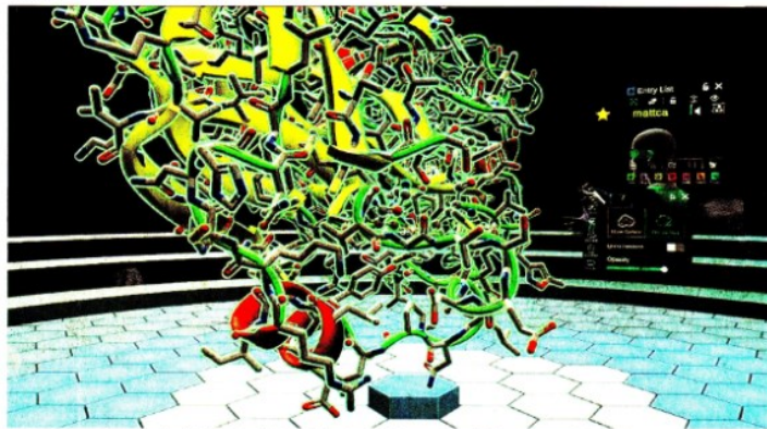
Contrasto al coronavirus. La molecola del raloxifene è stata individuata come efficace contrasto alle forme meno gravi di Covid-19

Dompé brevetta il farmaco per curare i primi sintomi Covid