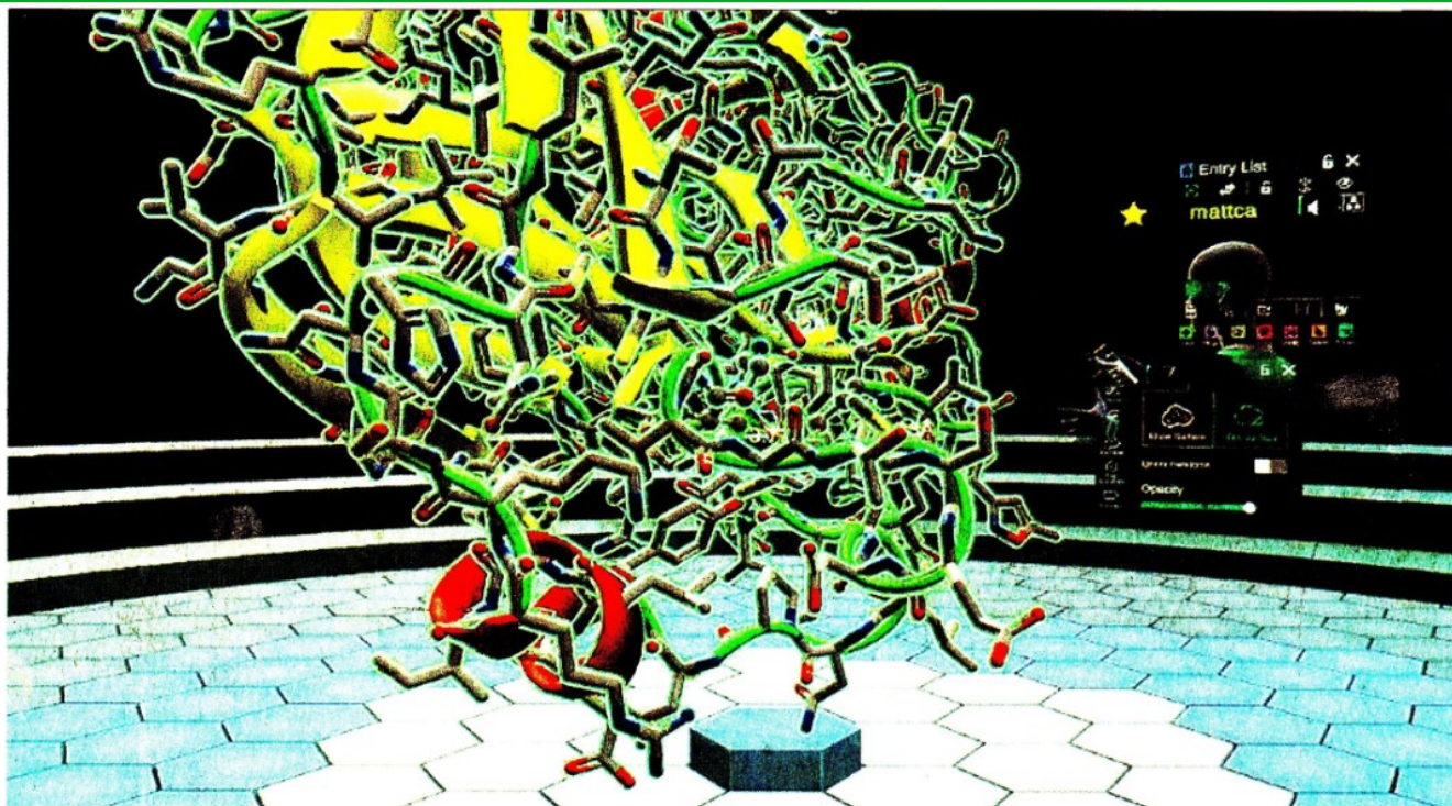
Contrasto al coronavirus. La molecola del raloxifene è stata individuata come efficace contrasto alle forme meno gravi di Covid-19