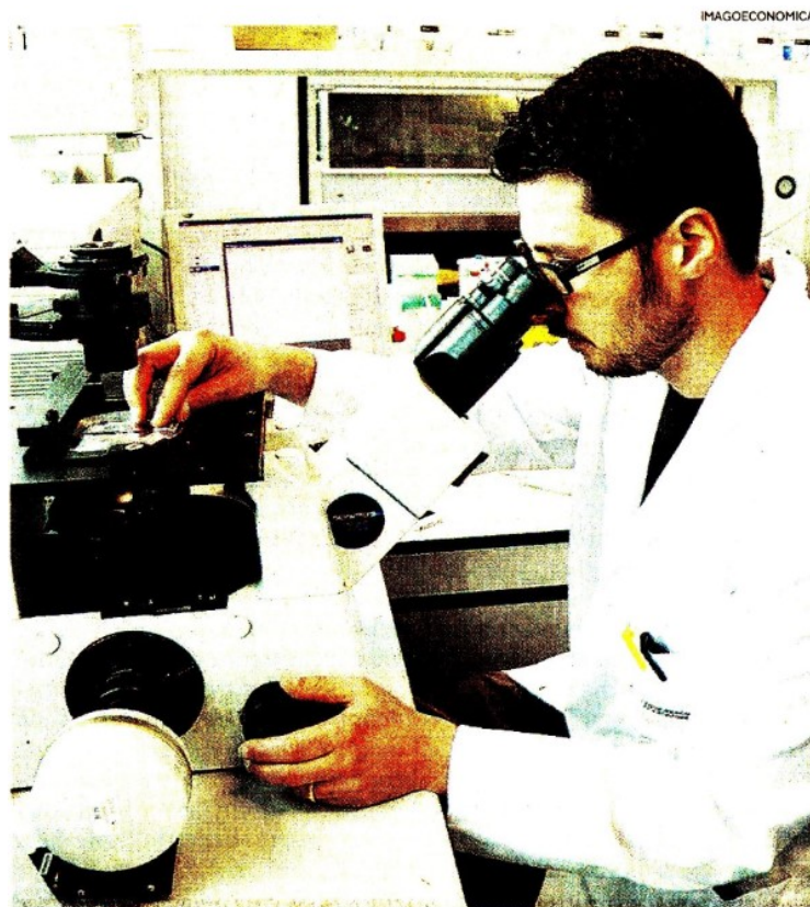
La ricerca in Italia. I laboratori della Dompé